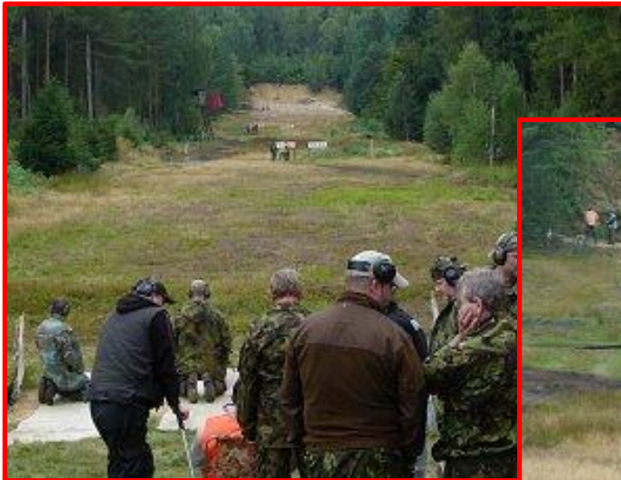
Hodnocení druhé části závodu