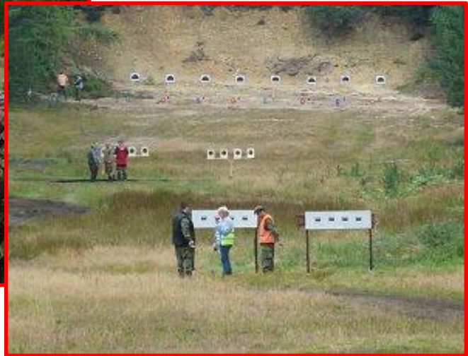
Rozhodčí u terčů ve 100, 200 a 300 metrové vzdálenosti

To nejtěžší ale závodníky teprve čekalo v podobě stranou běžícího terče, který ve vzdálenosti 300 metrů projede úsek 12 – 15 metrů rychlostí 2 – 3 m/s jednou na ukázkou a pětkrát pro výstřel. Pak již následuje jen rychlá střelba po čtyřech ranách do dvou terčů v čase 50 sekund ve stejné vzdálenosti.